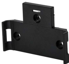
Abb. 2: Montagehalterung Ladegerät TS