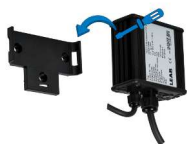
Abb. 3: Montage Ladegerät TS

Um das Ladegerät zu montieren, führen Sie die folgenden Schritte aus: